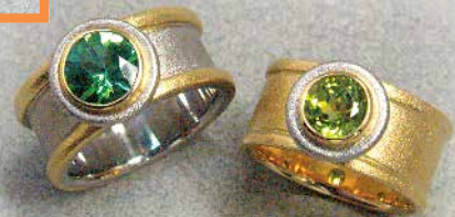
Ring · Gold/Palladium - Peridot · 1150,- €