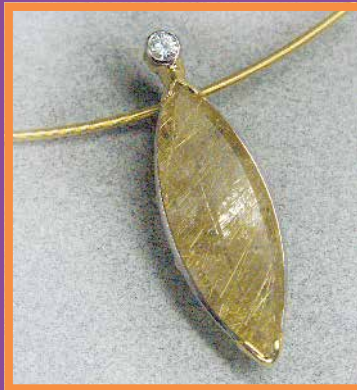
Anhänger · Palladium/Gold Rutilquarz - Brillant 0,17 ct 1310,- € Seilcollier · Gold 750 495,- €