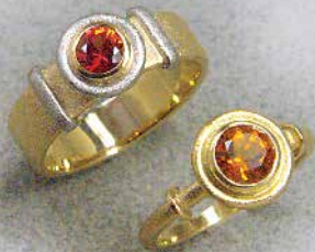
Ring · Gold 750 - Citrin · 540,- €