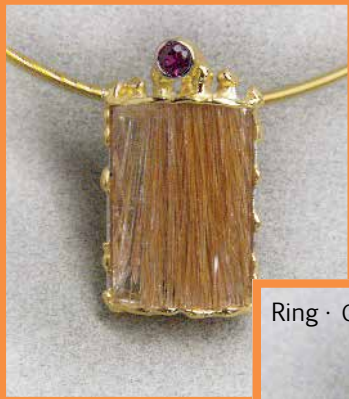
Anhänger · Palladium/Gold Rutilquarz - Umba Safir 1335,- € Seilcollier · Gold 750 495,- €